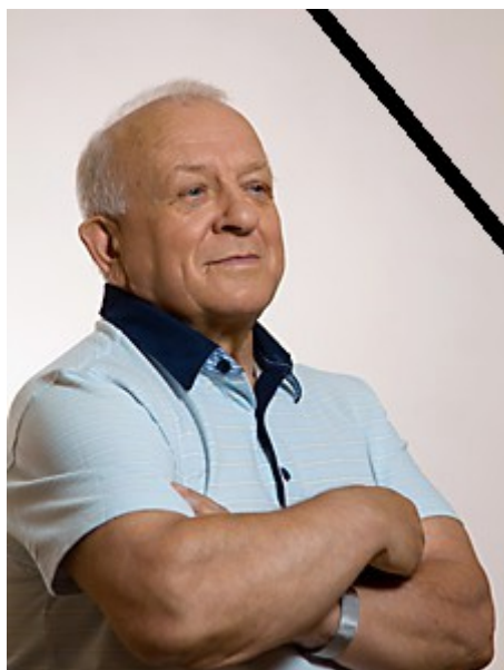
vor 2 Tagen verstorben

Dieses Training ist kein Sport und keine Medizin (obwohl beides auch mit dabei ist), sondern eine Bewusstseinschule. Die Entwicklung mit viel Spaß auf allen Ebenen zu einem Menschen mit unglaublichen Fähigkeiten – mit körperlicher und seelischer Gesundheit, Bewusstseinsenerweiterung (wie bei unseren Ahnen, welche die Gravitation – höchstes Weltall-Bewusstsein – beherrschten), mit heilerischen Fähigkeiten, Telepathie, mit dem Zugang zum „Kosmischen Internet“ uvm. Das Gravitationstraining wurde von Anatolij Samodumov im Jahre 1972 begründet. Er ist ein sehr bekannter Heiler, Forscher und Sportler, 74 Jahre alt und hebt selbst über 6,5 Tonnen. Dazu braucht man nicht Muskeln, oder Willen, oder mentale Befehle, sondern eine bestimmte Bewusstseinsstufe, Freude und Offenheit. Seit seiner Jugend beschäftigte er sich mit verschiedenen Sportarten, philosophischen Richtungen und diversen Methoden zur Selbstvervollkommnung. Aber weder das eine noch das andere stellte ihn zufrieden. Die wirklichen Entdeckungen machte er nach der Begegnung mit russischen Athleten, die im Gewichtheben Leistungen von 1.310 kg erreichten.