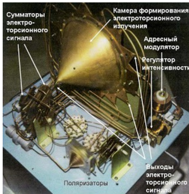
40 Jahre alter russischer Torsionsfeldgenerator Was das ist? hier erkläre ichs: klick